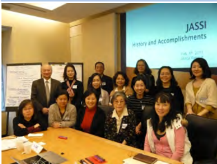
At JASSI board, staff and volunteer retreat, which was held on February 2011.

This past June, we received notification from New York City that because of financial cutbacks, funds for our senior program would be terminated. The Board convened an emergency meeting and reaffirmed JASSI's long-term commitment to provide services for seniors free of charge. Providing social services free of charge to members of the Japanese community is what distinguishes JASSI from other Japanese American organizations.